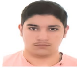
سلطان علام الدين